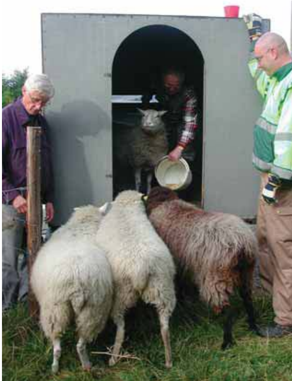
Eläinten kokoamisessa tarvitaan riittävästi väkeä.