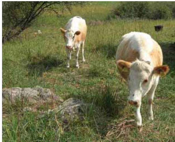
Itäsuomenkarjaa eli kyyttöjä

Alkuperäisrotut ovat suomalaista alkuperää olevia kotieläinrotuja, joiden määrä on vähentynyt hälyttävän harvalukuseksi. Rotuja ovat esimerkiksi suomenlampaat, länsi-, itä- ja pohjoissuomenkarja sekä suomenhevoset. Alkuperäisrotut sopivat erityisen hyvin luonnonlaitumien hoitoon. Ne ovat sopeutuneet Suomen olosuhteisiin ja ovat ravintotarpeeltaan vaatimattomampia kuin pitkälle jalostetut eläimet.