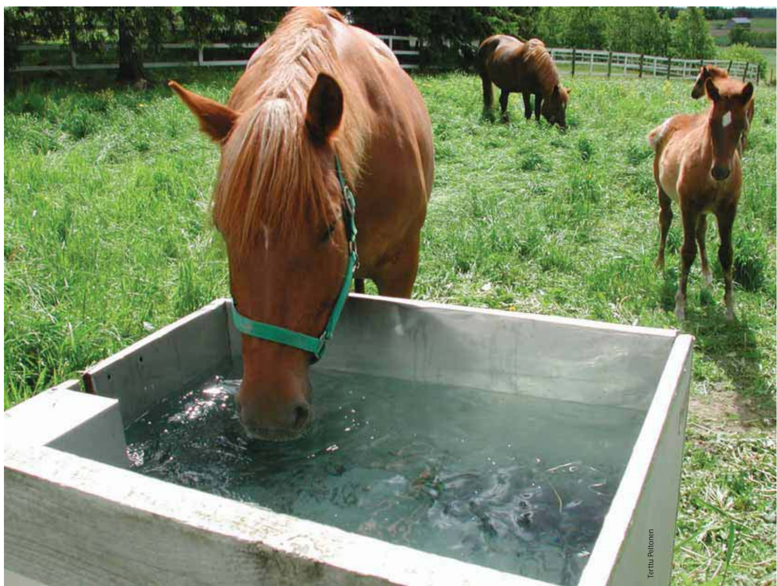
Hevoset tarvitsevat runsaasti raikasta vettä päivittäin.