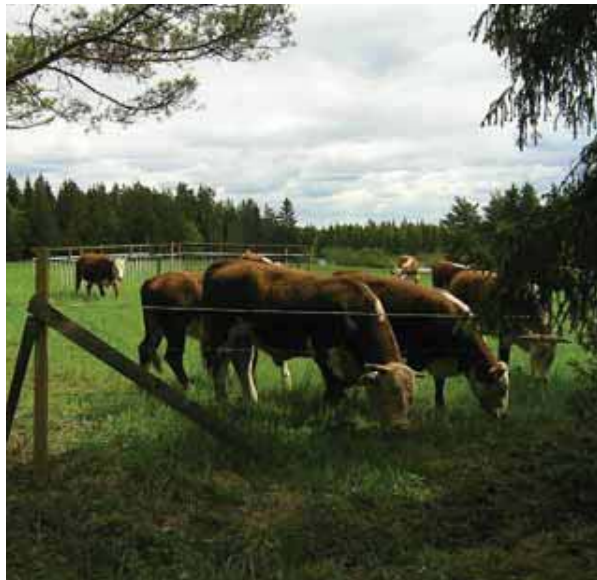
Sähköaita sopii moniin kohteisiin, mutta siitä pitää tiedottaa näkyvästi, jotta aitaa osataan varoa.

Laitumella olevilla eläimillä on oltava suoja auringolta sekä huonoja sääoloja vastaan. Käytännössä yleensä riittää, että laitumelta löytyy riittävästi