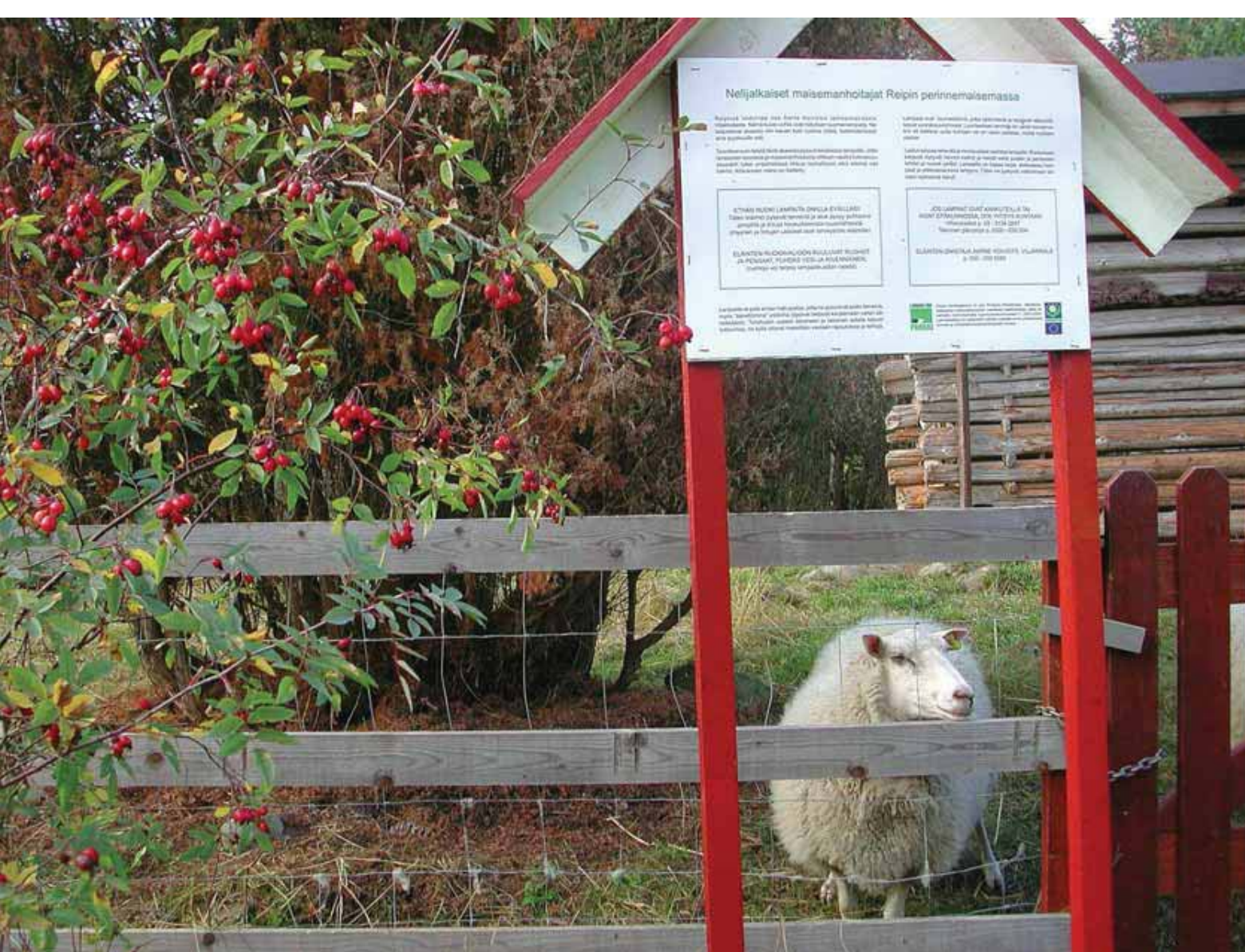
Virkistyskohteissa ovat tärkeitä sekä tiedottaminen että toimivat rakenteet. Laudoilla vahvistettu lammasverkko on kestävä aita, joka kestää kevyttä nojailemistakin.