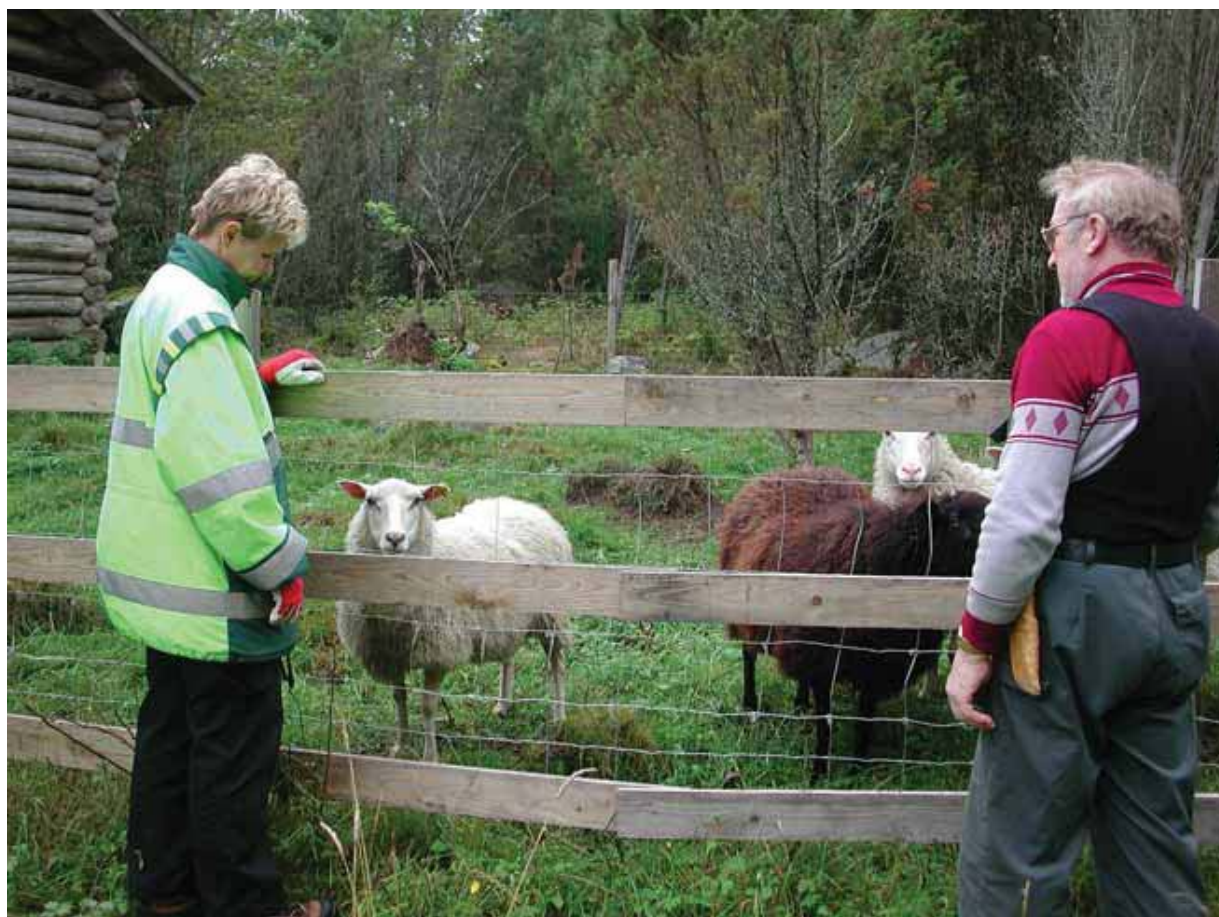
Eläinten päivittäiseen valvontaan kuuluu tarkkailla myös laidunrehun riittävyttä.

Rehevillä mailla nokkosen niittoon on syytä varautua laidunnuksen alkuvuosina, sillä eläimet eivät juurikaan syö sitä. Laidunnuksen jatkuessa maa köyhtyy ja nokkonen häviää vähitellen. Myös kosteina kesinä täydennysniitto voi olla tarpeen, mikäli laidun kasvaa niin paljon, että eläimet eivät ehdi syödä sitä riittävästi.