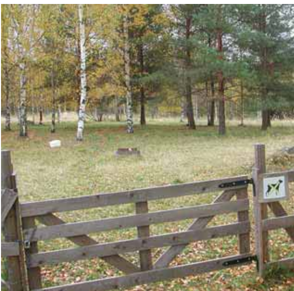
Lukittu portti ja koirakieltokyltti kertovat, että tämä laidun on yleisöltä suljettu alue.

suojaavaa puustoa sekä kuivia alueita makuupaikoiksi. Mikäli alue on kauttaaltaan avointa niittyä tai peltoa, täytyy paikalle rakentaa erillinen katos eläimiä varten.