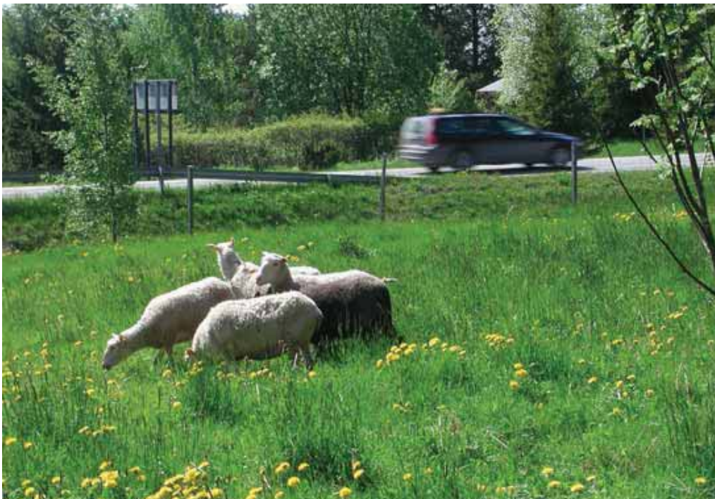
Omasta vakuutusyhtiöstä tulee tarkistaa, että vakuutukset sopivat maisemalaidunnukseen.

Pankkiin voi kuka tahansa jättää ilmoituksensa ja tarjota kohteita laidunnettaviksi tai eläimiä maisemanhoitajiksi. Tutustu maisemalaidunnuksen mahdollisuuksiin ja rekisteröidy Laidunpankin käyttäjäksi! Rekisteröityminen on maksutonta ja mahdollistaa hakupalvelun käytön. Oman ilmoituksen lisääminen edellyttää maksullisen käyttöajan ostamista.