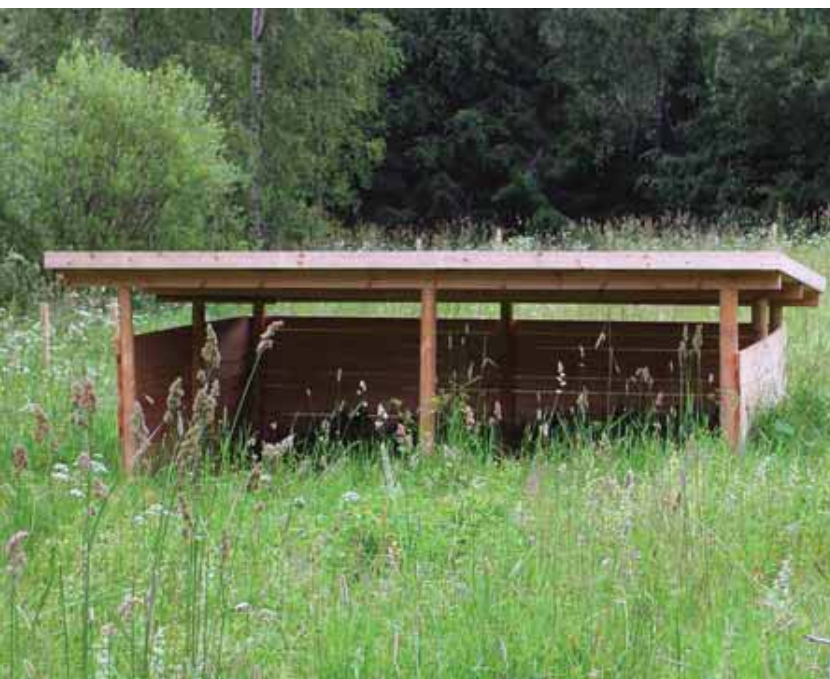
Avoimella alueella eläimet tarvitsevat katoksen suojaksi säältä.