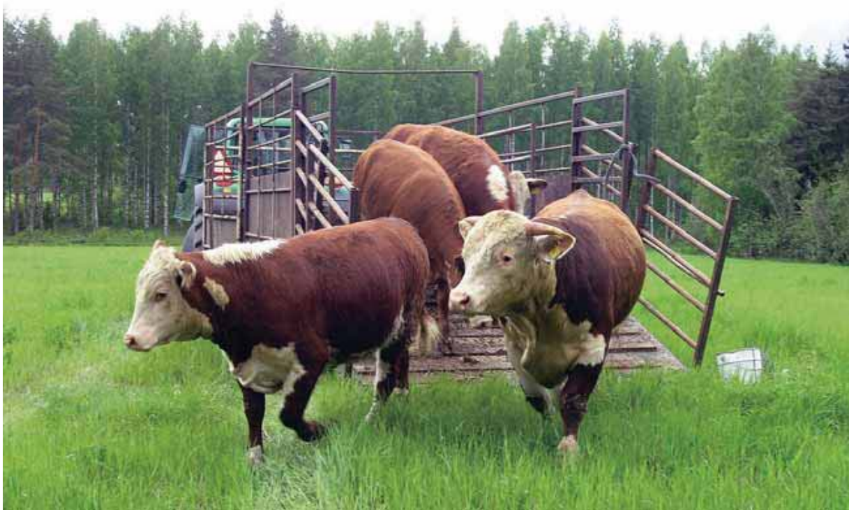
Eläinten siirrot sujuvat helpommin, kun kuljetuskalusto saadaan ajettua laitumelle.

Eläinten käsittelyssä siirrettävät ja koottavat aitaukset ovat hyviä apuvälineitä kuten myös painenkoirat, mikäli eläimet ovat tottuneet koiriin. Rauhallinen toiminta ja oikein rakennetut aitaukset mahdollistavat eläinten käsittelyn ja kiinniottamisen. Riittävää ja toistuvaa seurustelua eläinten kanssa ei kuitenkaan korvaa mikään apuväline.