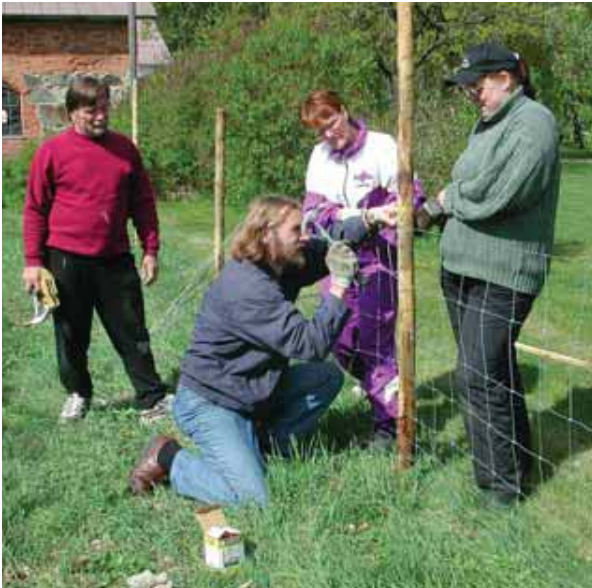
Lammasverkko on pitkäaikainen aitamateriaali. Tolppien tulee olla tukevia ja valmistettu kestävästä materiaalista.