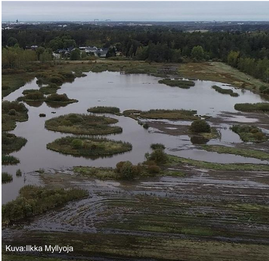
Kuva: Ilkka Myllyoja